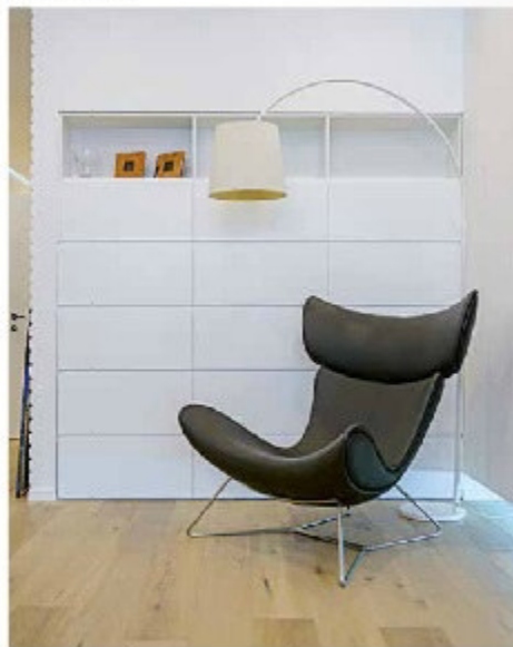
Аксессуары мебели. Детали светильника и стула. Форма кресла повторяет архитектуру, массивная и интегрирована в него.