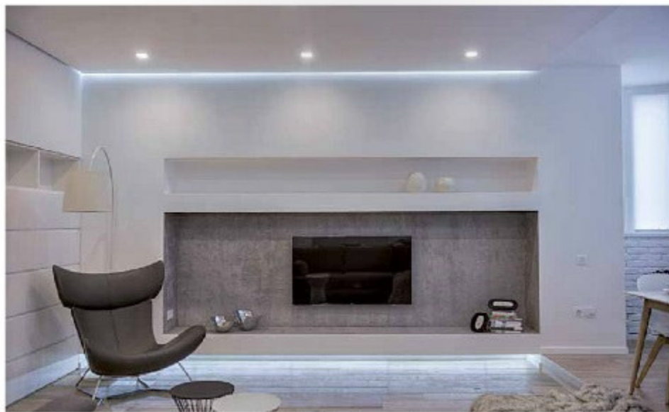
На полу в гостиной установлена модель паркета: керамический гранит FRAME ATLAS CONCORDE, итальянский плиточный завод и паркетная доска, макетовый бетонный подиум, коврик и текстиль.