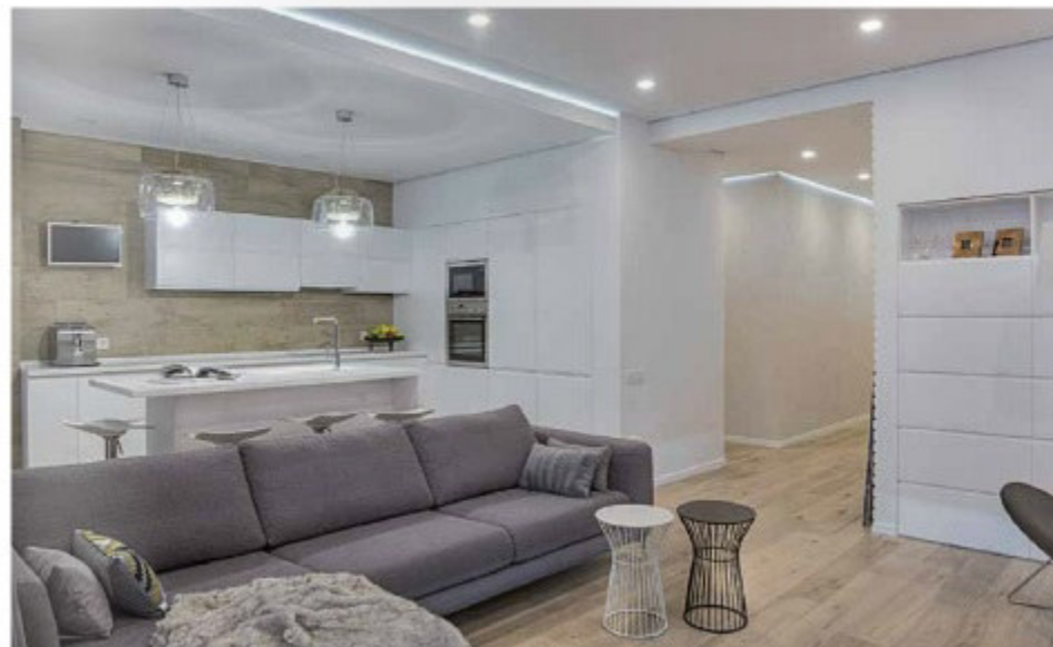
Курно от галстучной в фойе гостиница отделяет кухню — бар. Эргономичный дизайн в сочетании с архитектурой в стиле-дежавай галереи.